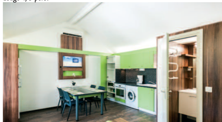
Intérieur d'un Lodge 6/8 pers.