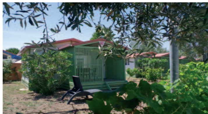
Lodge 4/5 pers.

Bar/Restaurant en haute saison. Nombreux services et commerces à proximité en haute saison, 3 grands marchés par semaine (juillet et août).